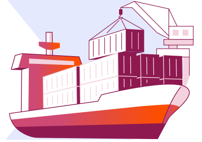
Nihai alıcılar (deniz taşımacılığında)